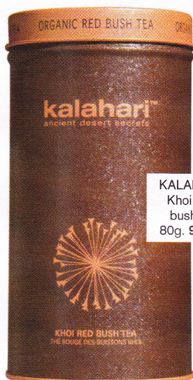
KALAHARI Khoi red bush te. 80g. 95 kr.