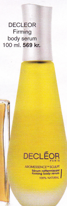
DECLÉOR Firming body serum 100 ml. 569 kr.