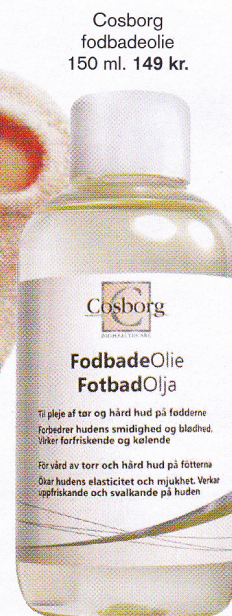
Cosborg fodbadeolie 150 ml. 149 kr.