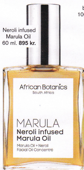
Neroli infused Marula Oil 60 ml. 895 kr.

African Botanics Marula Neroli Infused Oil indeholder, som navnet siger, marula-olie, der er godt på vej til at blive den nye argan-olie. Marula er ikke kun rig på alle de livsnødvendige fedtsyrer, huden har brug for, men er også en sund frugt for den lokale økonomi: Alt fra frugten kan anvendes, og den plukkes og samles af lokale kvinder, som derigennem får en indtægt. Decleor Firming body serum indeholder opstrammende ingredienser og er et velegnet supplement til den øvrige fysiske træning, der sigter mod opstramning, som fx pilates eller crossfit. Også ideel at bruge i forbindelse med væggtab for at holde huden fast og gennemfugtet.