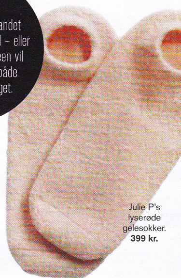
Julie P's lyserøde gelesokker. 399 kr.

TIP Tilsæt et par skefulde te i badevandet for et forfriskende bad – eller i et fod/håndbad. Teen vil efterlade din hud både opfrisket og beroliget.